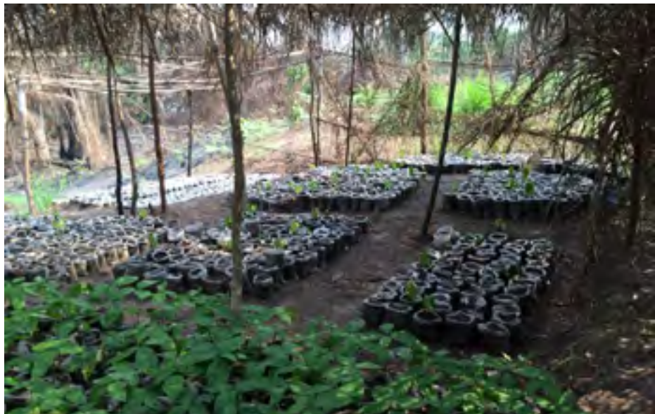
Plantules de cacao et de palmier, CATPC Lusanga 2016