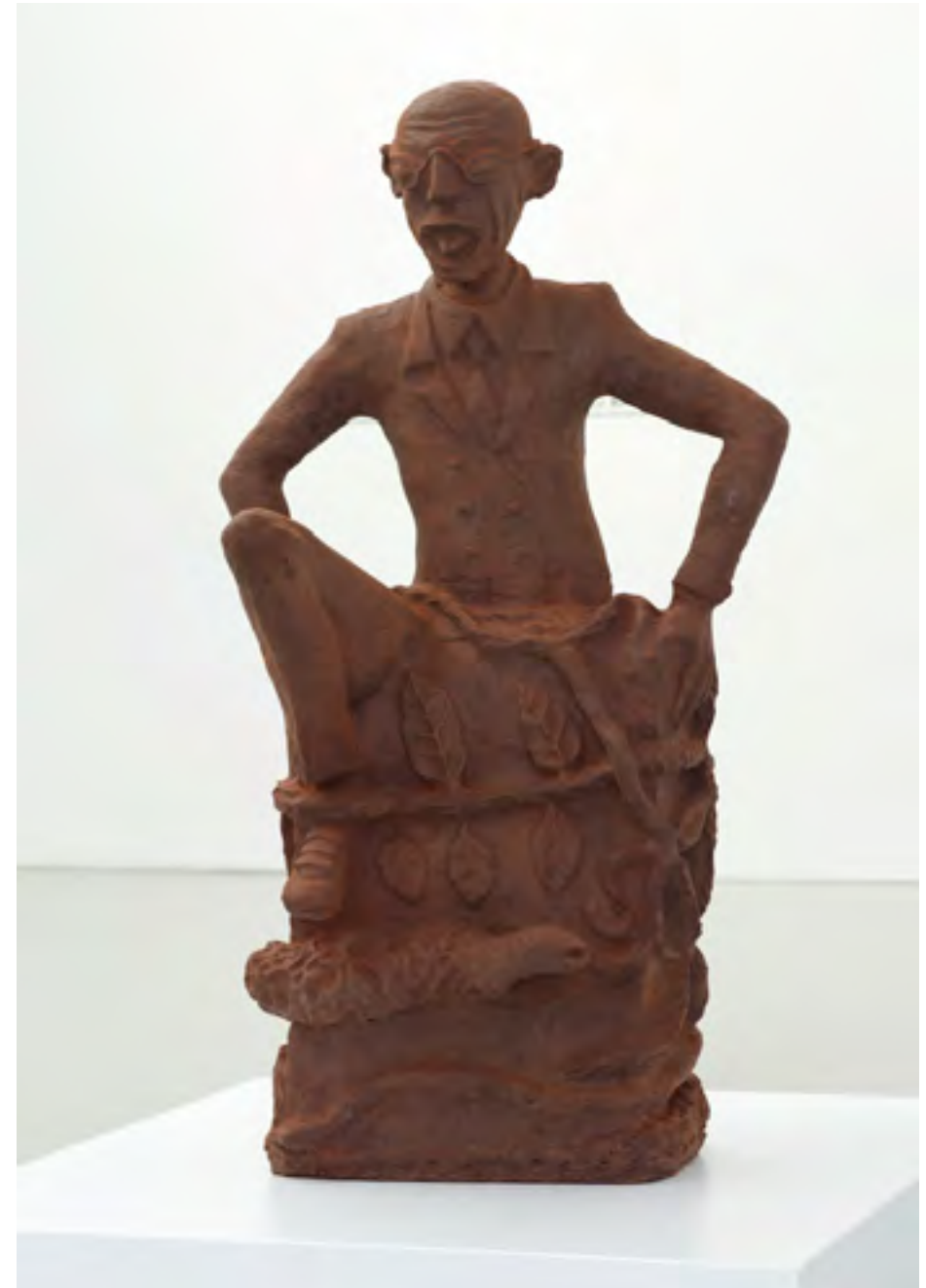
The Art Collector / Le Bailleur de fonds - Sculpture en Cacao, Jérémie Mabilia - CATPC 2015

Le colloque La Matière de la Critique rassemble des artistes, chercheurs, (anciens) travailleurs de plantation et membres du CATPC parmi les plus actifs du Congo et d'ailleurs. Ensemble, nous imaginons des manières de rendre utiles l'art et la créativité, mais aussi l'espace rural, les chaînes de valeur actuelles et le centre de recherches en tant qu'outil spéculatif.