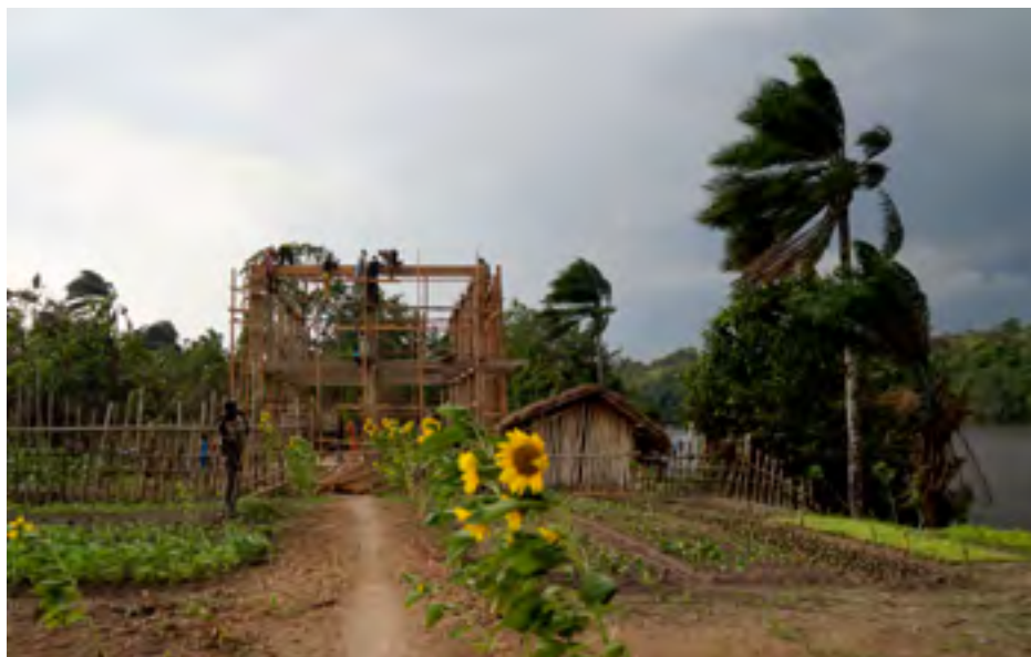
Vue du centre de conférence depuis la pépinière, Lusanga 2016