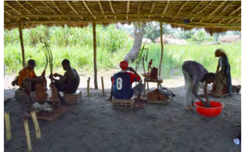
L'atelier de sculpture, Lusanga - CAPTC 2015

Quelles sont les stratégies de légitimation des biennales et des musées africains ? De quelle manière ont-elles réussi à contrebalancer les mécanismes de ségrégation culturelle à l'échelle mondiale ? Comment prendre en main la spéculation sur les conséquences économiques de l'art ?