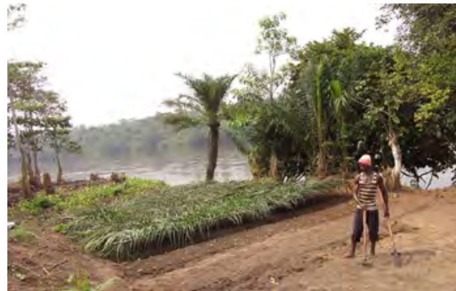
Pépinière au bord de la Rivière Kwenge, Lusanga 2016