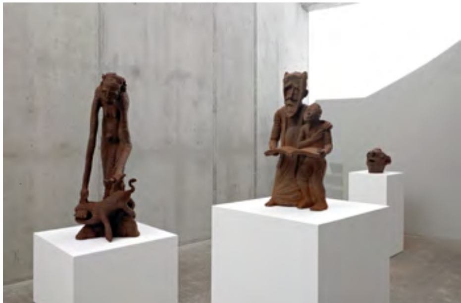
A Poisonous Miracle (2014) de Emery Mohamba et How my Grandfather survived (2014) de Cédrick Tamasala, sculptures en cacao en vue à l'exposition A Lucky Day , KOW Gallery, Berlin