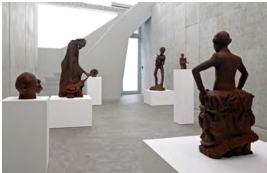
Vue sur l'exposition A Lucky Day , KOW Gallery, Berlin, 2 mai - 26 juillet 2015