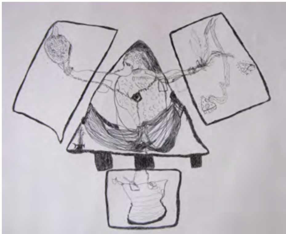
Résistance - Dessin, Mathieu Kasiama - CATPC 2016

LUSANGA - République démocratique du Congo