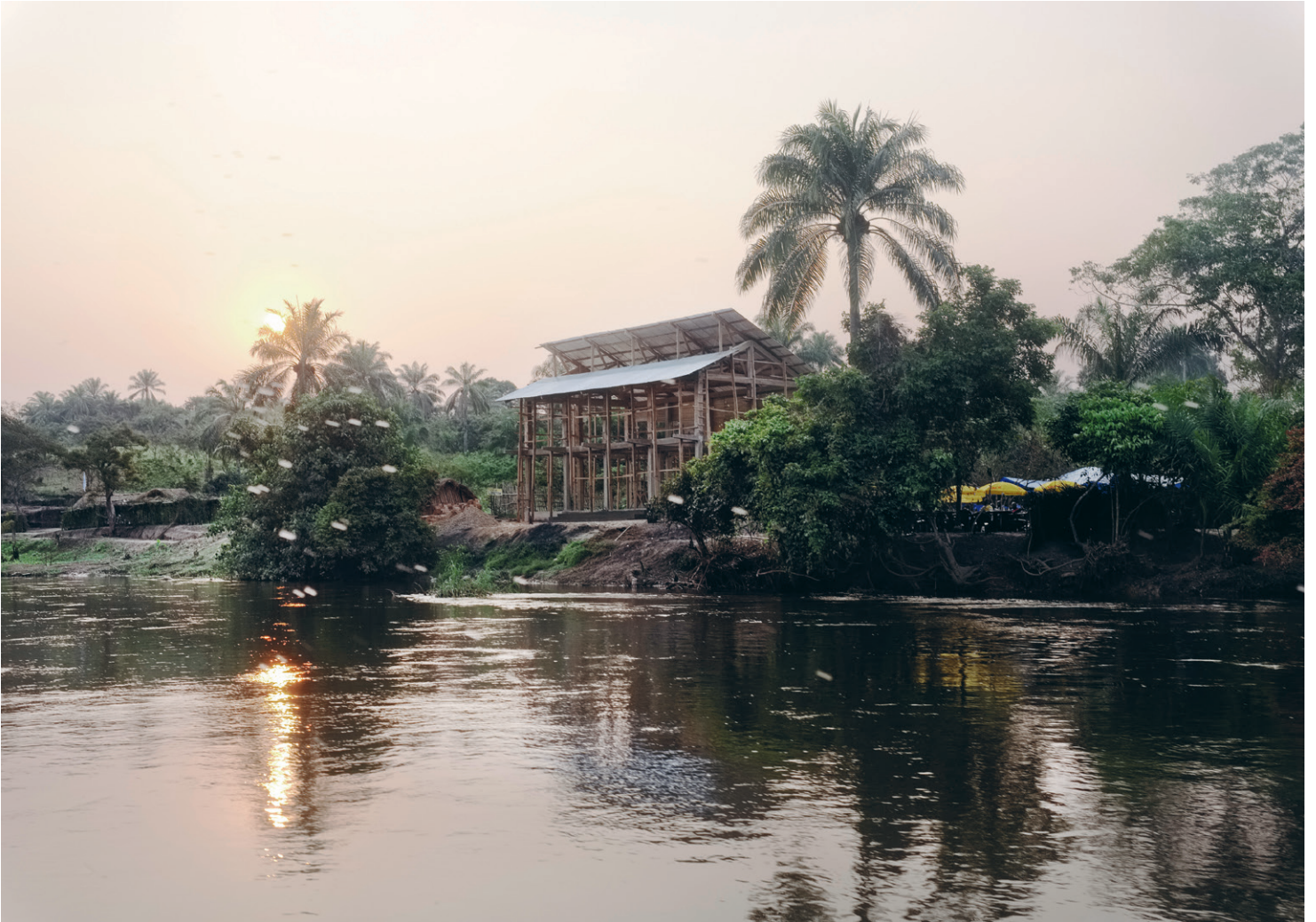
Lusanga, view from the River Kwenge onto the conference center designed by OMA, IHA settlement (former Unilever)